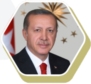
Ekselansları Sayın Recep Tayyip Erdoğan Türkiye Cumhurbaşkanı

Umman Sultanlığı'nın 2040 Vizyonu, ülkenin ekonomik çeşitliliğini artırmayı, sürdürülebilir kalkınmayı sağlamayı ve özel sektörle uluslararası iş birliğini güçlendirmeyi amaçlayan iddialı bir stratejik plandır.