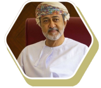
Sultan Haitham bin Tarik Al-Mu'azzam Umman Sultanlığı Sultanı ve Başbakanı

Türkiye Cumhurbaşkanı Ekselansları Recep Tayyip Erdoğan, Cumhurbaşkanlığı Külliyesi'nde gerçekleştirilen baş başa ve heyetler arası görüşmenin ardından Umman Sultanı Heysem bin Tarık ile düzenlenen ortak basın toplantısında "İlişkilerimize kurumsal bir çerçeve kazandırmak arzusundayız. Bu amaçla, Yüksek Düzeyli Stratejik İş Birliği Mekanizması dâhil, istifade edebileceğimiz çeşitli seçenekleri ele aldık. Dış ilişkiler, ekonomi, sanayi, yatırım, sağlık, kültür, tarım ve hayvancılık gibi alanlarda iş birliğimizi ilerletmeye yönelik 10 belge imzalandı. Ortak bildiri kabul edildi. Ekonomi ve ticari ilişkilerimizi, mevcut potansiyelimizi yansıtacak şekilde ilk aşamada 5 milyar dolara çıkarmayı hedefliyoruz. Müteahhitlik firmalarımız, Umman'da bugüne kadar 7 milyar dolar değerinde projeyi başarıyla tamamladı. Aziz kardeşimle, şirketlerimizin Umman 2040 Vizyonu'na yapabilecekleri katkılara da değindik. Bu vesileyle, Umman heyetinin yarın Türk iş dünyasının temsilcileriyle yapacağı toplantıdan somut neticeler alınmasını temenni ediyorum. BOTAŞ ile Ummanlı muhatabı arasında imzalanan anlaşma uyarınca, 2025 yılından itibaren Umman'dan sıvılaştırılmış doğalgaz tedarikine başlanacak olmasıyla, enerji alanındaki iş birliğimizde yeni bir döneme girmiş olacağız." diye konuşmuştur.